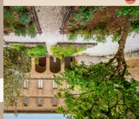
13 Jardin des Simples vers la galerie