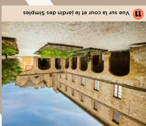
11 Vue sur la cour et le jardin des Simples