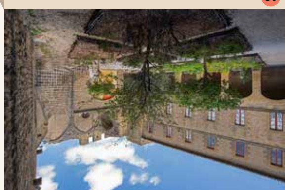
12 Jardin vers les escaliers d'accès à la terrasse