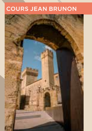
2 Vue du château depuis la porte d'Angoulême