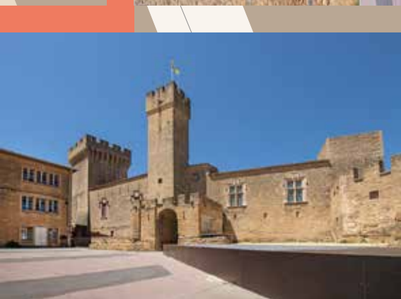
3 Cour Jean Brunon. Au centre la tour du Guet