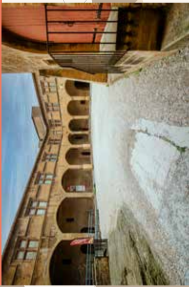
6 Cour Jean Blanchard