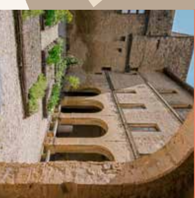
14 Sortie de la salle des Écuries vue sur le jardin et la galerie