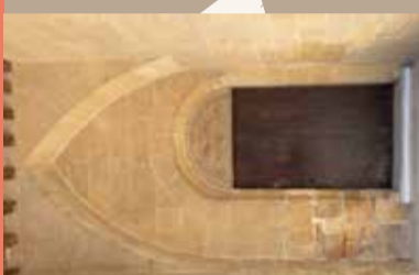
8 Entrée du musée de l'Empéri