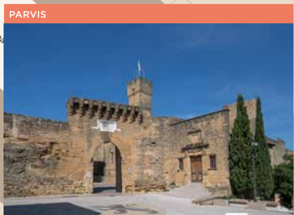
1 Parvis (Porte d'Angoulême, Maison de justice)