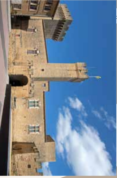
Facade méridionale du château.

LONGUEUR DU ROCHER : 172 MÈTRES LARGEUR MAXI : 59 MÈTRES LOGEUR EMPRISE DU BÂTI DU CHATEAU : 87 MÈTRES