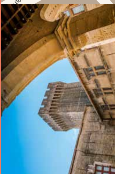
7 Tour Pierre de Cros