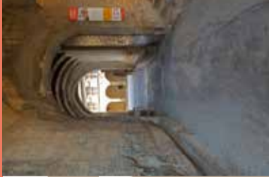
5 Passage vers la cour Jean Blanchard