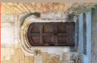
9 Porte des Anges