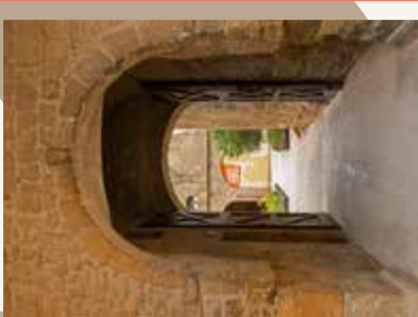
10 Passage vers le Jardin