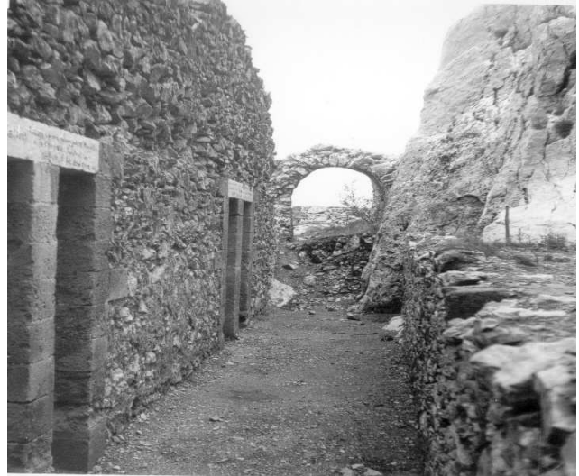
Le Déambulatoire du Prieuré de Sainte-Victoire