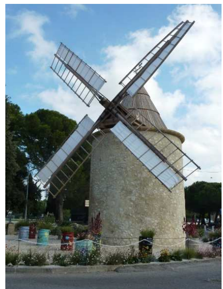
Le Moulin de Bertoire à Lambesc