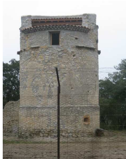
Le pigeonnier de la forêt de Cadarache