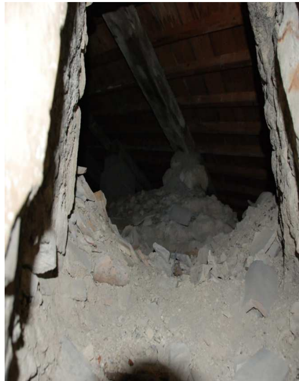
Eglise Sainte Julitte Lançon de Provence