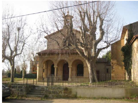
La chapelle St Mitre à Aix