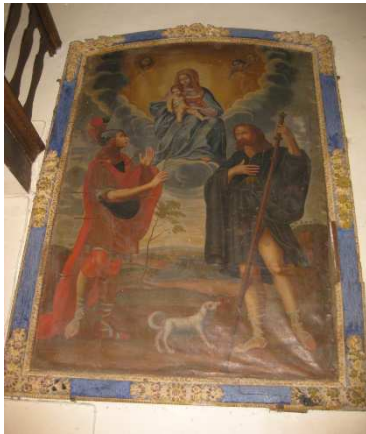
Tableau dans l'Eglise Saint Paul les Durance