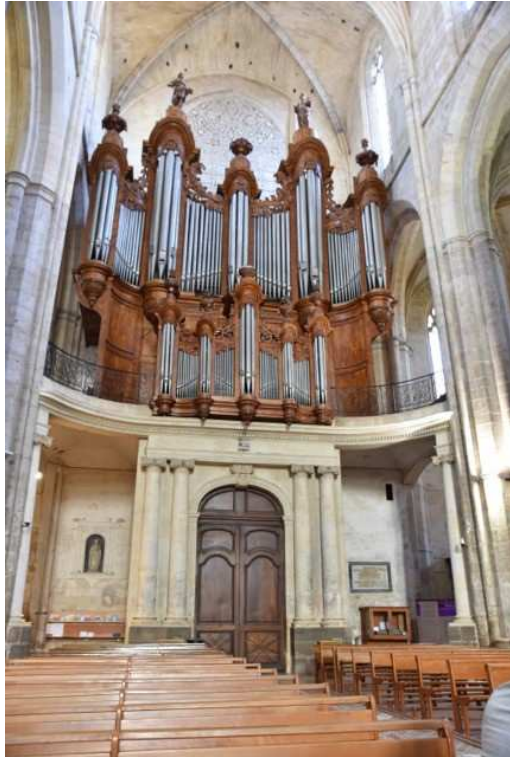
Orgues de la basilique