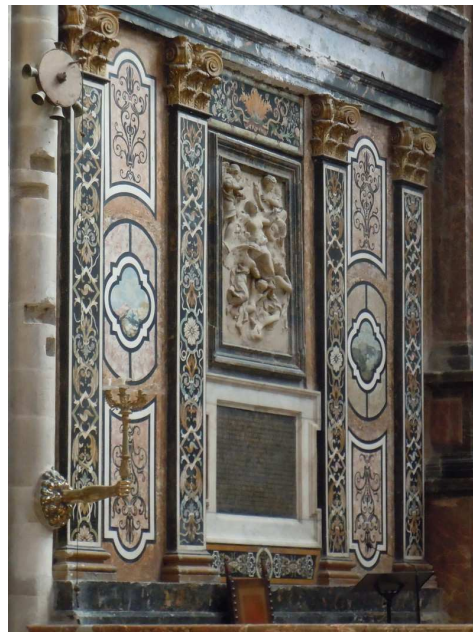
Décorations en marbre des parois du chœur

Visite très instructive qui s'est poursuivie par celle du « cloître royal » qui faisait partie du couvent des Dominicains. Ces derniers ont quitté les lieux en 1957 et le couvent abrite désormais un hôtel dont les chambres sont aménagées dans les anciens logements des religieux.