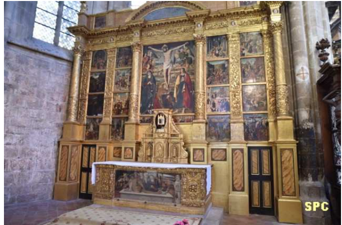
Retable d'Antoine Ronzen, datant de 1520